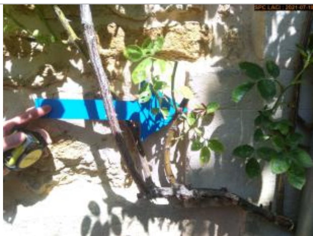
Vue du repère rapprochée en 2021

Altitude calculée de l'eau (en m) : 204.005 m