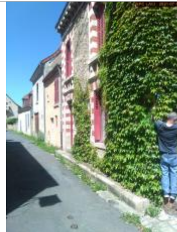
Vue du site en 2021