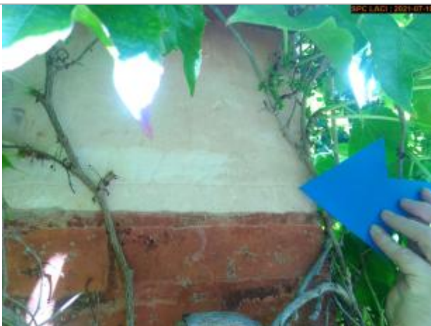
Vue du repère rapprochée en 2021