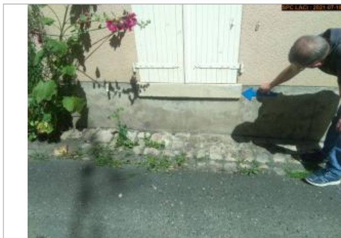
Vue du repère rapprochée en 2021