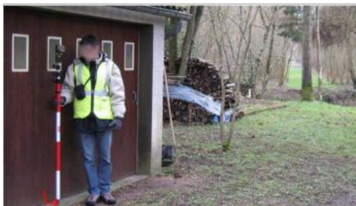
Photo du repère en 2010