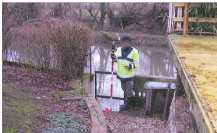
Photo du repère en 2010