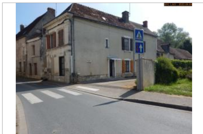
Vue du site (entrée du chemin privé) en 2022

GÉOLOCALISATION Coordonnées WGS84 : X: 1.17821480 / Y: 46.98743100 Coordonnées RGF93 (Lambert 93) X: 561549 / Y: 6655732.04 Coordonnées RGF93 (ETRS89) : X: 1.1782148 / Y: 46.987431 Code Hydro: K7--0260 Rive de référence: Gauche