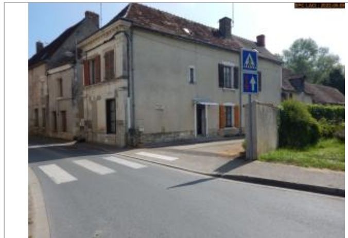
Vue du site (entrée du chemin privé) en 2022

Coordonnées WGS84 : X: 1.17821480 / Y: 46.98743100