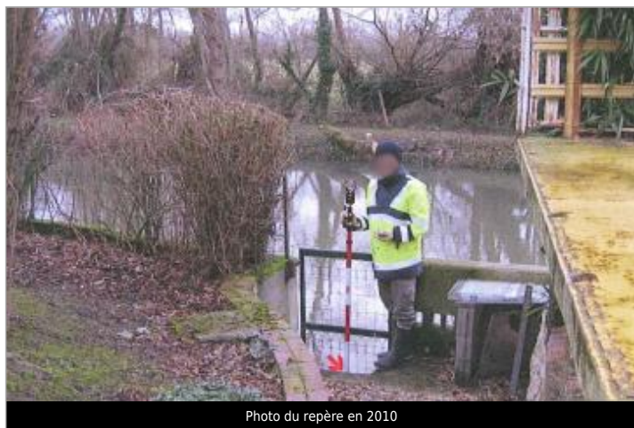
Photo du repère en 2010