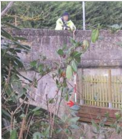
Photo du repère en 2010