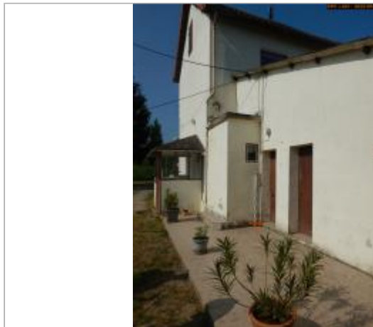
Vue du site en 2022