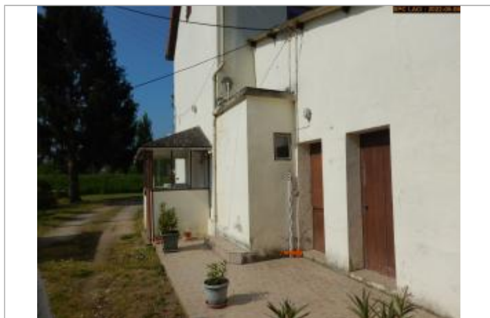
Vue du repère en 2022

Altitude calculée de l'eau (en m) : 86.66 m