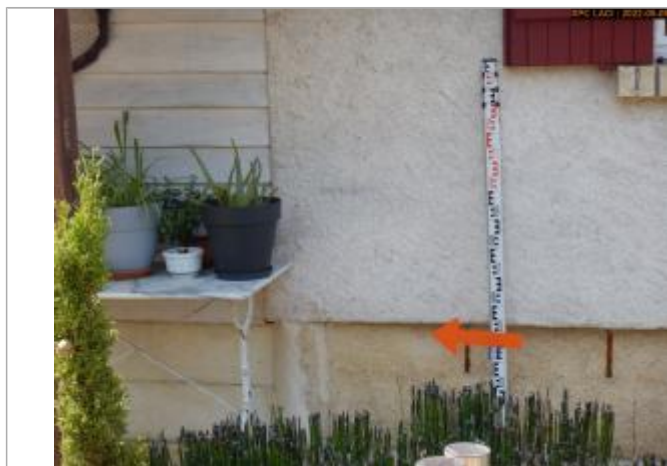
Vue du repère en 2022

Altitude calculée de l'eau (en m) : 86.29 m