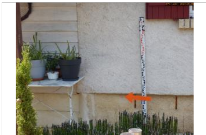
Vue du repère en 2022

Altitude calculée de l'eau (en m) : 86.29 m