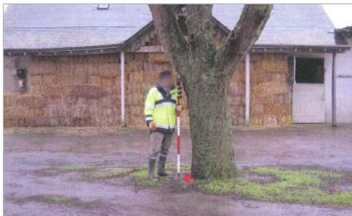
Photo du repère en 2010