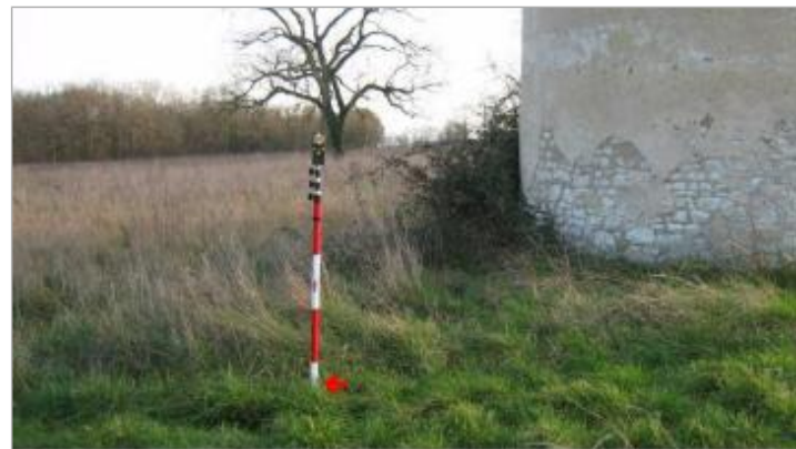
Photo du repère en 2010

GÉNÉRAL Code : LCI_R_2213_3452 Date de mise à jour : 09/01/2023 Auteur : SPC LCI