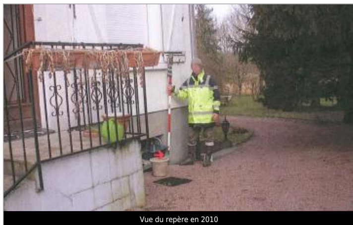
Vue du repère en 2010