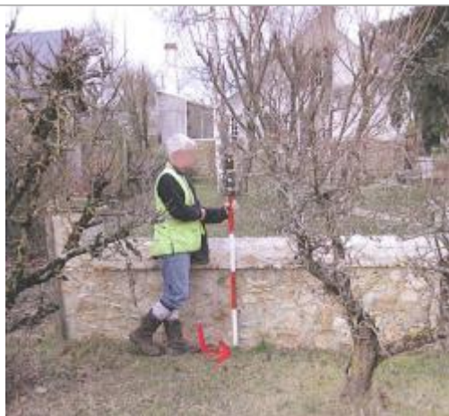
Vue du repère en 2010