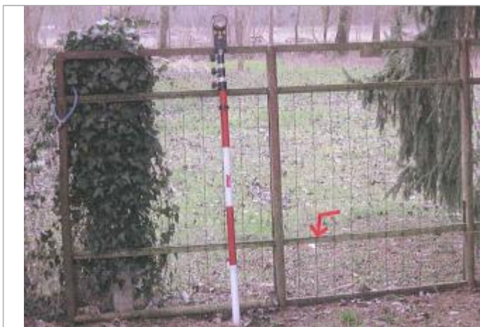
Vue du repère en 2010

Altitude calculée de l'eau (en m) : 53.88 m