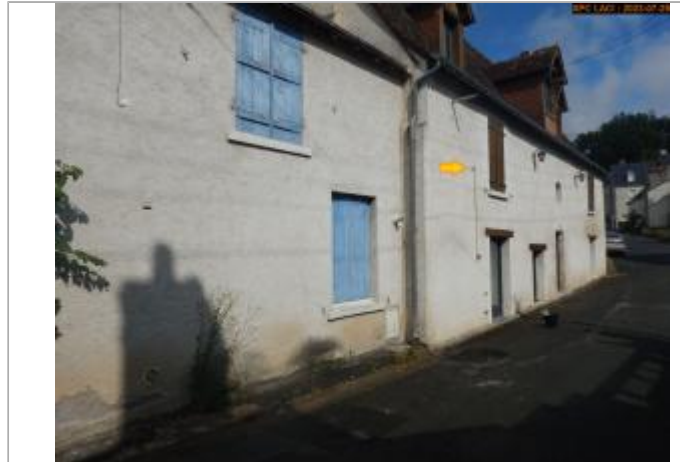
Vue du site en 2023

Coordonnées WGS84 : X: 0.83473270 / Y: 47.27137430