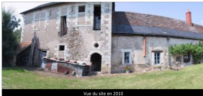
Vue du site en 2010