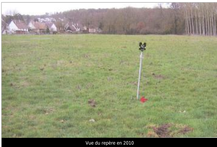
Vue du repère en 2010