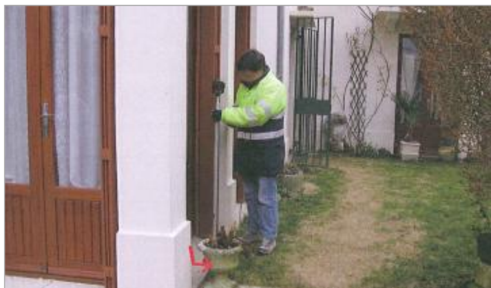
Photo du repère en 2010

SOURCE DE REPÉRAGE : CETE NORMANDIE-CENTRE, LE CHER ET L'INDRE, RECENSEMENTS 2010-2011 - 01/12/2011