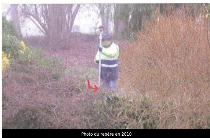
Photo du repère en 2010