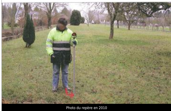
Photo du repère en 2010