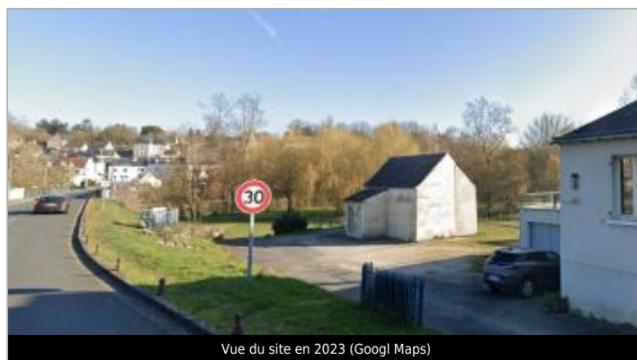
Vue du site en 2023

GÉOLOCALISATION Coordonnées WGS84 : X: 0.87620936 / Y: 47.24841460 Coordonnées RGF93 (Lambert 93) X: 539382.09 / Y: 6685283.41 Coordonnées RGF93 (ETRS89) : X: 0.8762094 / Y: 47.2484146 Code Hydro : K7--0260 Rive de référence : Non renseigné