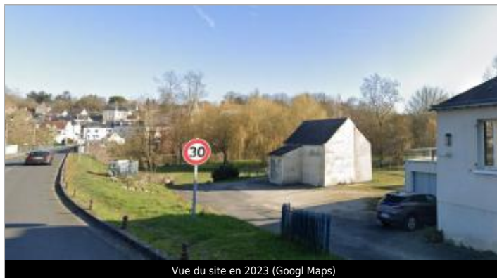
Vue du site en 2023