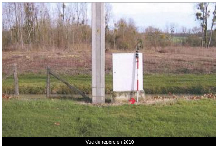
Vue du repère en 2010