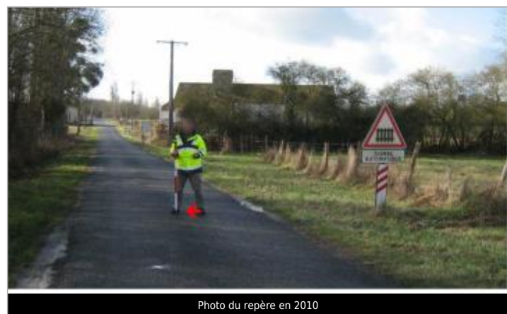
Photo du repère en 2010

GÉNÉRAL Code : LCI_R_1855_3054 Date de mise à jour : 21/08/2023 Auteur : SPC LCI