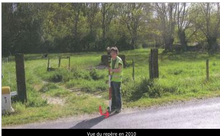
Vue du repère en 2010