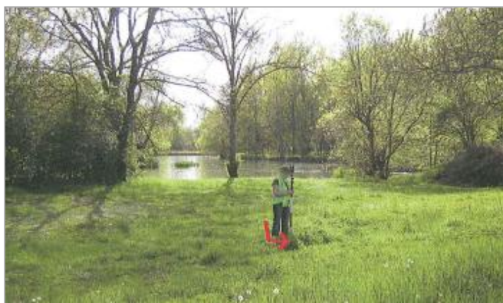
Vue du repère en 2010