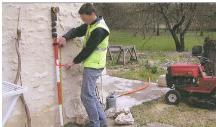
Vue du repère en 2010