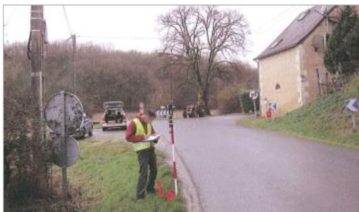
Vue du repère en 2010