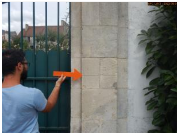
Vue du repère éloignée

Altitude calculée de l'eau (en m) : 161.196 m