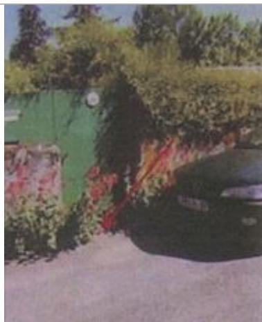
Vue du repère en 2010