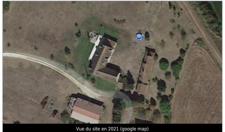
Vue du site en 2021 (google map)