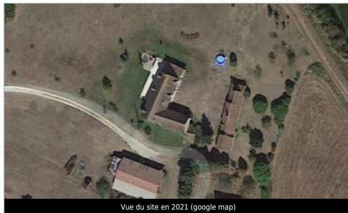
Vue du site en 2021 (google map)

GÉOLOCALISATION Coordonnées WGS84 : X: 2.34504280 / Y: 47.76983900 Coordonnées RGF93 (Lambert 93) X: 650942 / Y: 6741252.95 Coordonnées RGF93 (ETRS89) : X: 2.3450428 / Y: 47.769839 Code Hydro: ----0000 Rive de référence: Gauche