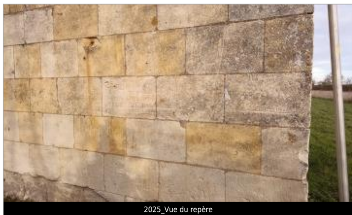
2025_Vue du repère

Altitude calculée de l'eau (en m) : 22.83 m