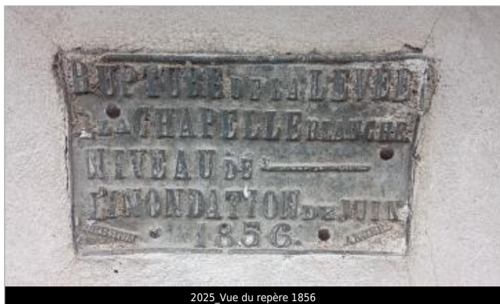
2025_Vue du repère 1856