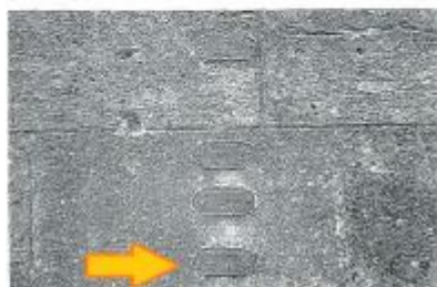
Vue du repère (MAJ 2023)