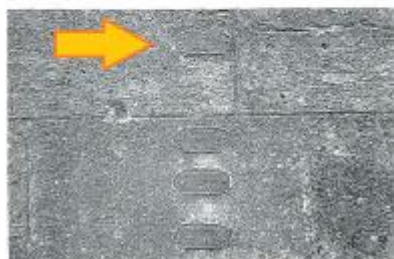
Vue du repère (MAJ 2023)