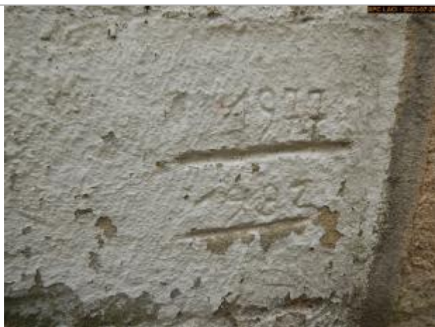
Vue du repère en 2023

Altitude calculée de l'eau (en m) : 54.027 m