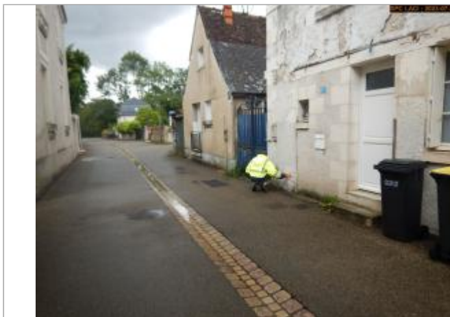
Vue du site en 2023

Coordonnées WGS84 : X: 0.71614560 / Y: 47.28731040