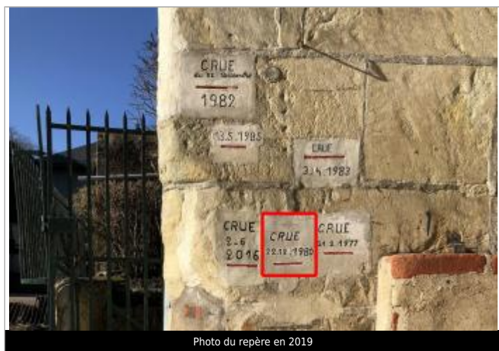
Photo du repère en 2019

Altitude calculée de l'eau (en m) : 43.58 m