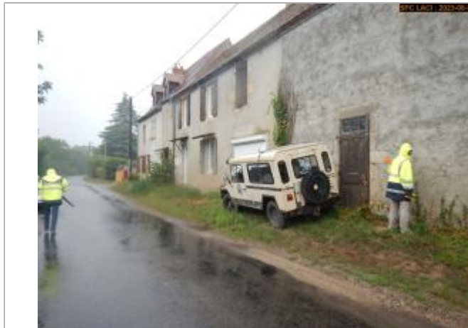
Vue du site en 2023

Coordonnées WGS84 : X: 3.04613744 / Y: 46.76348880