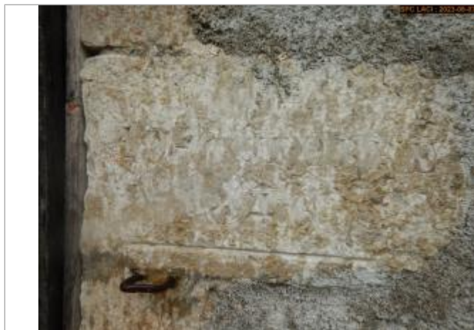
Vue du repère en 2023

Altitude calculée de l'eau (en m) : 188.455 m