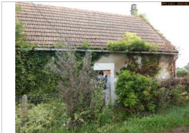
Vue du site en 2023 (1er repère en croix)

Coordonnées WGS84 : X: 3.16798640 / Y: 46.70242940