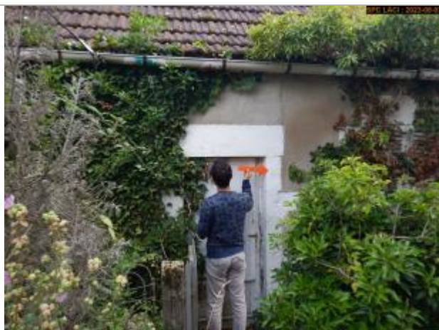
Vue du repère en 2023