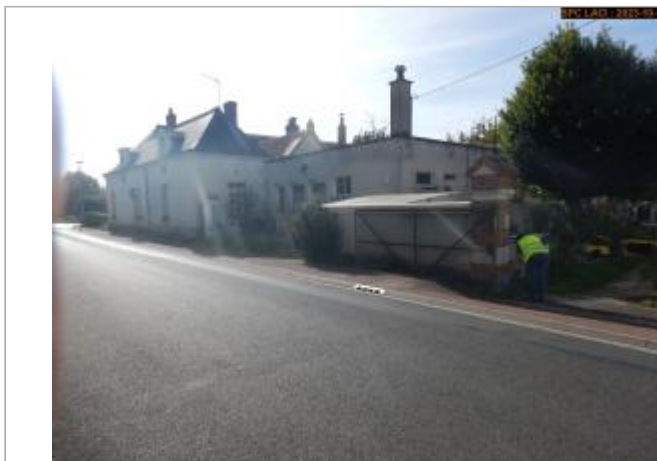
Vue du site en 2023