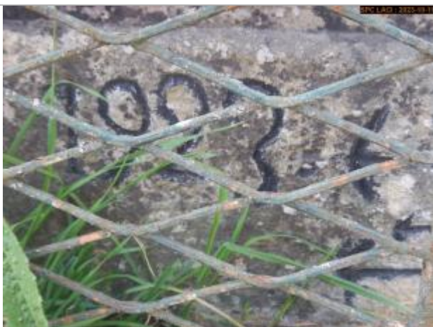
Vue du repère en 2023

Altitude calculée de l'eau (en m) : 51.461 m