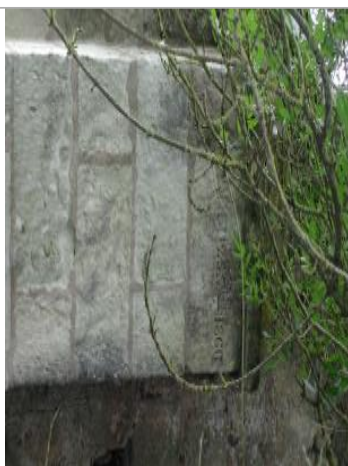
Vue détaillée du repère

Altitude calculée de l'eau (en m) : 46.22 m