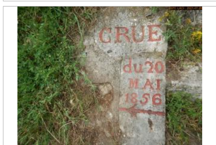
Vue du repère en 2021 escalier côté rampe

GÉNÉRAL Code : LCI_R_619_2068 Date de mise à jour : 11/02/2022 Auteur : SPC LCI