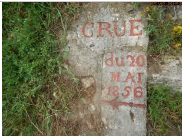
Vue du repère en 2021 escalier côté rampe

Altitude calculée de l'eau (en m) : 104.2 m