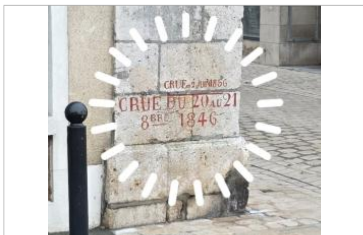
Vue rapprochée des deux repères historiques de 1846 et 1856, photo prise le 15 décembre 2025.

Code : LCI_R_202_2067 Date de mise à jour : 29/01/2026 Auteur : SPC LCI