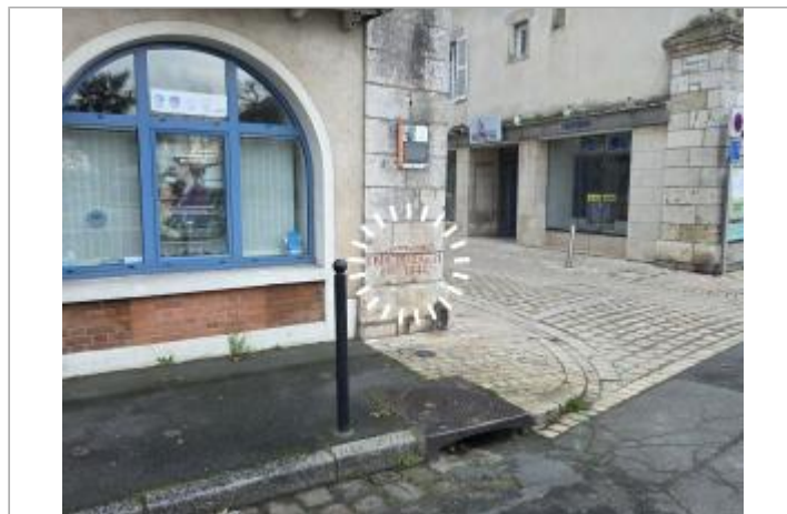
Photo du site et des deux repères historiques, décembre 2025.