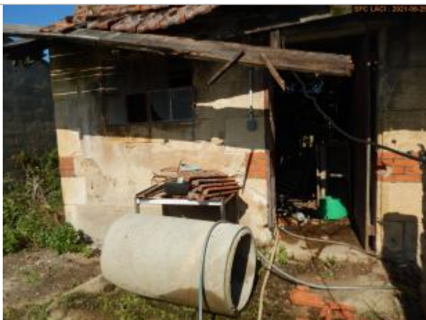
Vue du repère en 2021