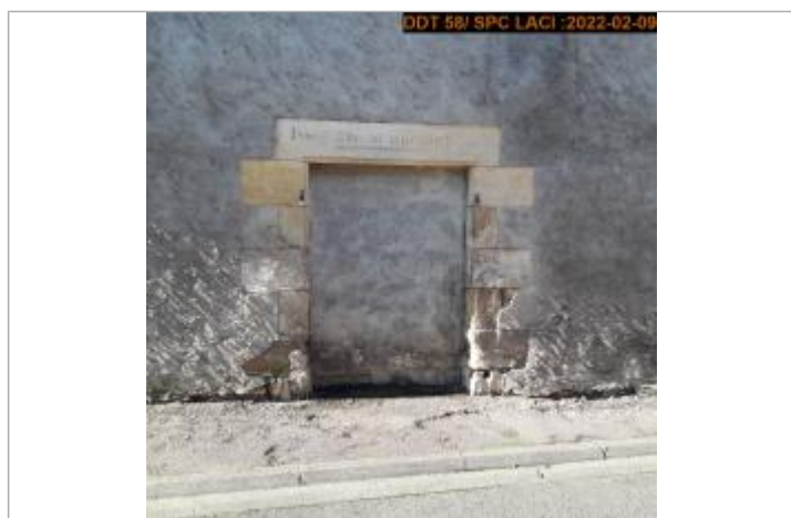
Vue du repère en 2022

Code : LCI_R_978_1994 Date de mise à jour : 11/02/2022 Auteur : SPC LCI