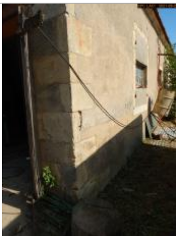
Vue du repère en 2021