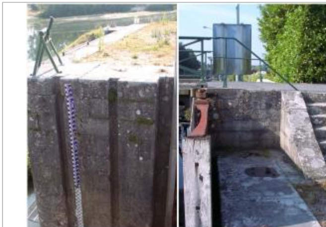
Vue sur site : l'échelle et le musoir de l'écluse