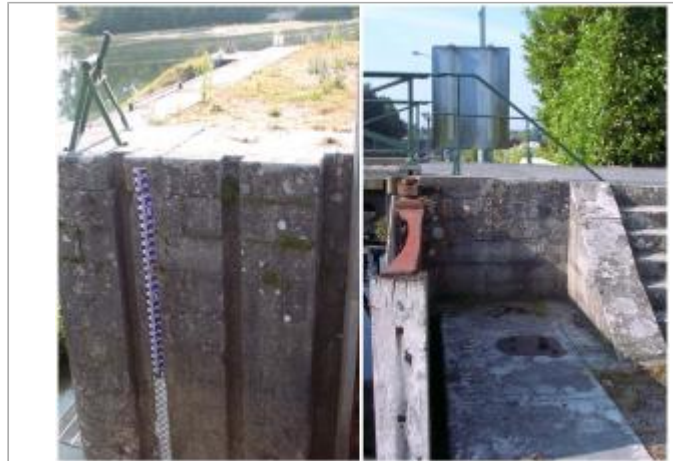
Vue sur site : l'échelle et le musoir de l'écluse