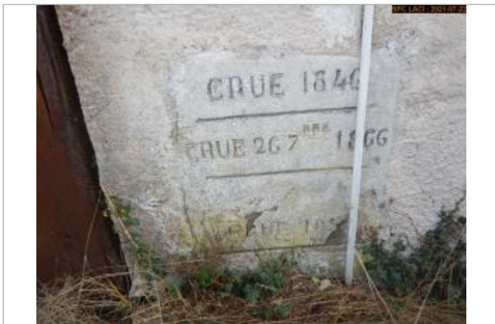
Vue du repère en 2021

Altitude calculée de l'eau (en m) : 197.7 m