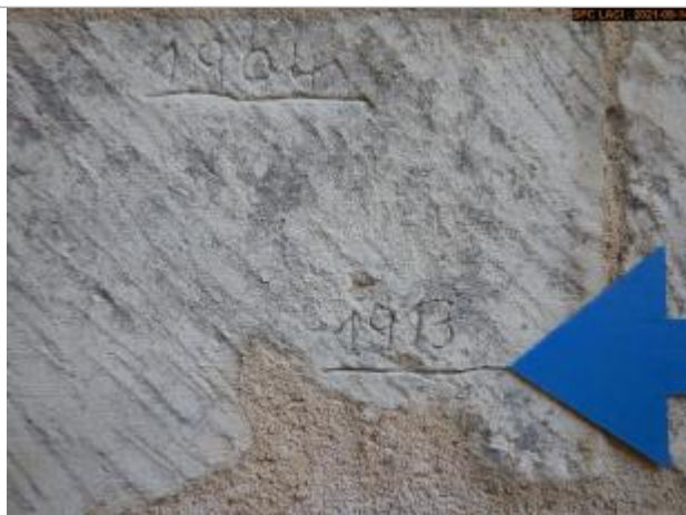
Vue du repère rapprochée en 2021

Système altimétrique : NGF IGN 1969 (système normal)